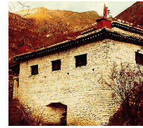
The "Temple Of Miraculous Fire" at Muktinath, Nepal. Photo by Ken Street (Nov. 1979).

[For more on this subject, please read our tract The Temple Of Miraculous Fire .]