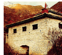
The "Temple Of Miraculous Fire" at Muktinath, Nepal. Photo by Ken Street (Nov. 1979).

[For more on this subject, please read our tract The Temple Of Miraculous Fire .]